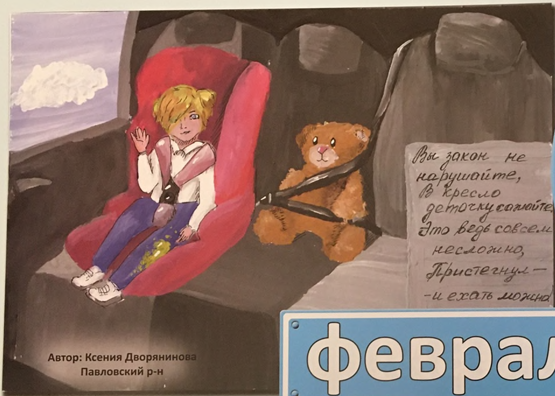
Автор: Ксения Дворянинова Павловский р-н